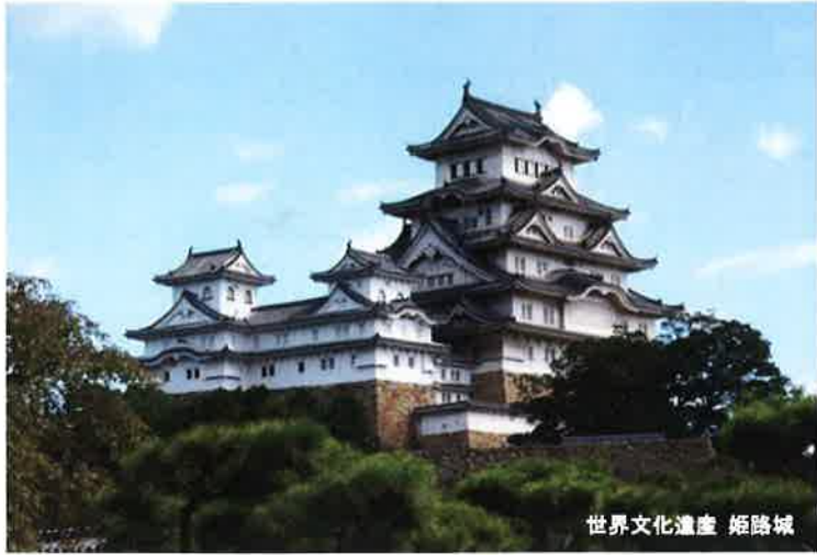
世界文化遺産 姫路城