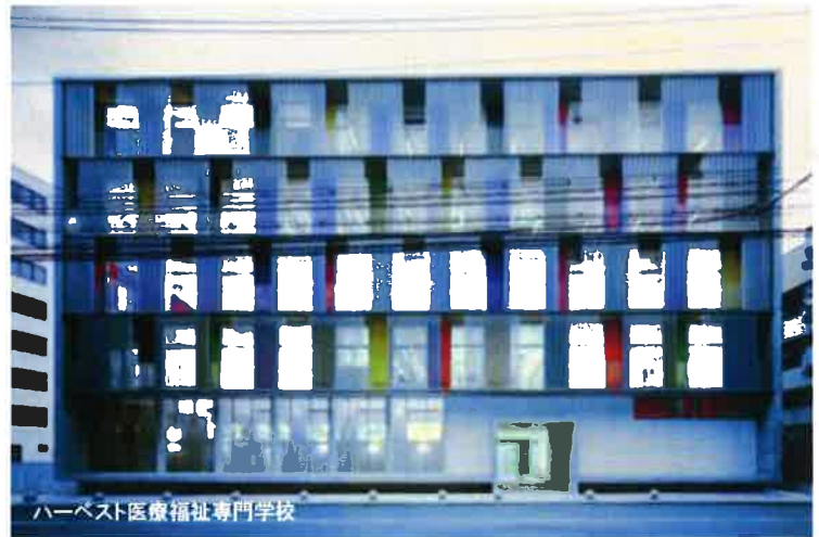
ハーベスト医療福祉専門学校

定員 40名 (参加費無料)※スリッパ各自持参 ※昼食代各自 <CPD:4単位>